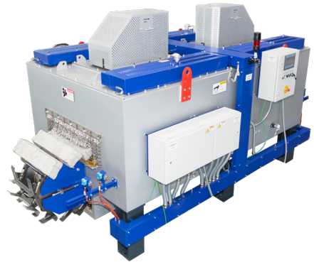
Magnesium Massel Vorwärm- und Beschickungseinrichtung MVE1200E