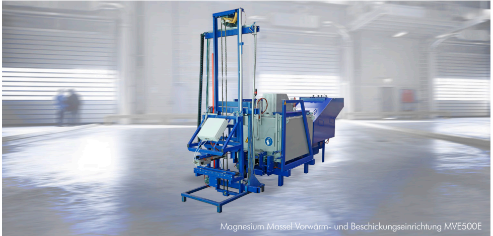
Magnesium Massel Vorwärm- und Beschickungseinrichtung MVE500E