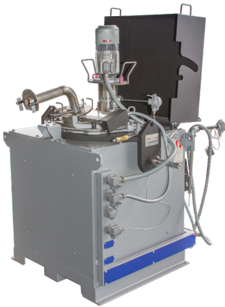
Magnesium Laborofen MLO130

RAUCH Universal Schmelz- und Gießöfen können auch in Verbindung mit Aluminium und Magnesium Niederdrucksystem (NGS) verwendet werden.