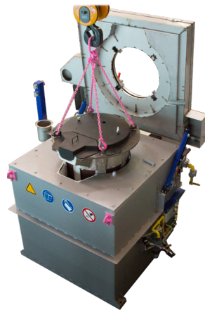
Entnahme des Tiegels mittels Kran